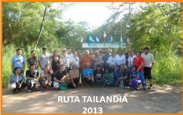
RUTA TAILANDIA 2013