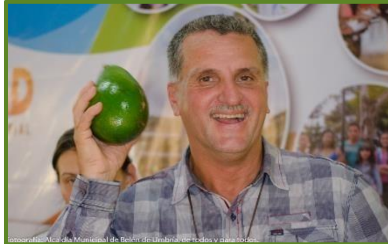
Fotografía: Alcaldía Municipal de Belén de Umbria, de todos y para todos.