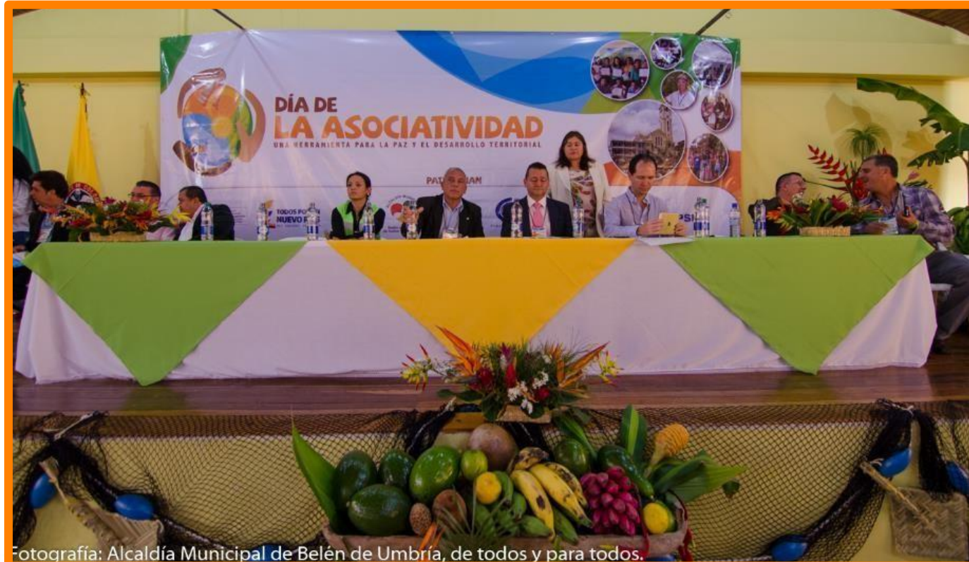
Fotografía: Alcaldía Municipal de Belén de Umbría, de todos y para todos.